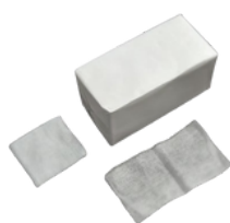
Compresse non stériles