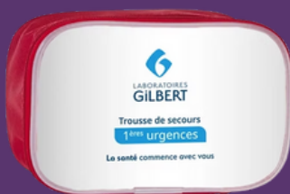
Trousse de secours