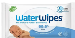
Lingettes bébé WaterWipes