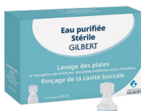
Eau purifiée stérile